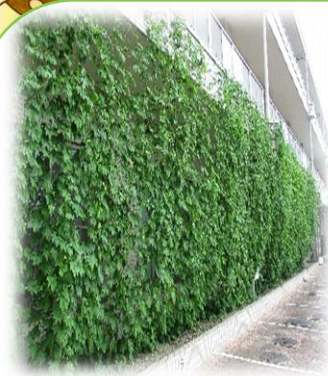
今年もグリーンカーテンが出来ました。