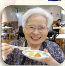
今月は昼食のお楽しみメニューとして、甘みと酸味のバランスが絶妙なお取り寄せの桃が提供されました！皆さん「美味しい」と召し上がられました。

春はぼたもち、秋はおはぎという言葉があります。春と秋のお彼岸にお供えする和菓子の呼び名です。春の花「牡丹」でぼたもちは、収穫後時間が経ってかたくなった小豆の皮を裏ごして作ったこしあんを使い、秋の花「萩」にちなんだおはぎは収穫してすぐの皮が柔らかい小豆で作った粒あんを用いるところが多いようです。