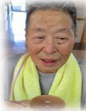
敷地内の畑に赤しそを植え、収穫し紫蘇ジュースにさせていただきました。